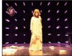
Gabrielle Émilie du Châtelet Annie Jump Cannon Margaret Burbidge